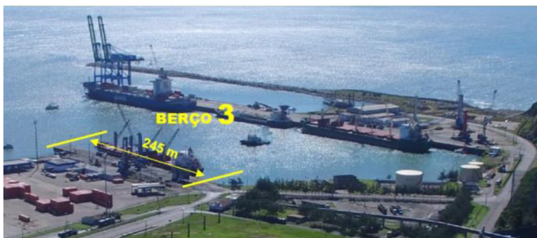
Figura 2 - Berços de Atracação

O canal de acesso ao Porto de Imbituba tem comprimento de 3.703 metros indo até o centro da bacia de evolução e de 3.425 metros considerando a interseção com a bacia de evolução, com larguras de 240 metros na curvatura e de 200 metros em trechos retos.